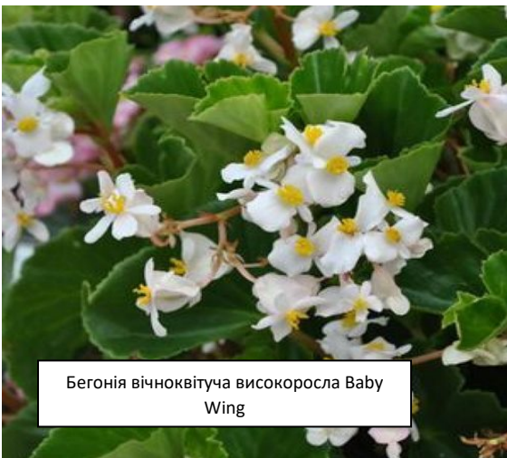
Бегонія вічноквітуча високоросла Baby Wing

Baby Wing – сортосерія з великими, сильними кущами, види мають зелене і бронзове забарвлення листя, квітки бувають однотонними і двоколірними різних забарвлень.