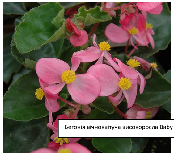
Бегонія вічноквітуча високоросла Baby Wing

Lotto – великий компактний кущ вічноквітучий бегонії з смарагдово-зеленим листям і незвичайно великими для цього виду простими квітками різних забарвлень.