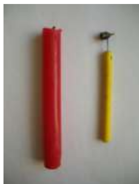
Свічка і писачок