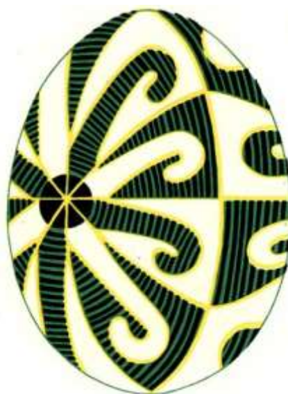
Писанка, орнамент «Козачі левади». Одещина.