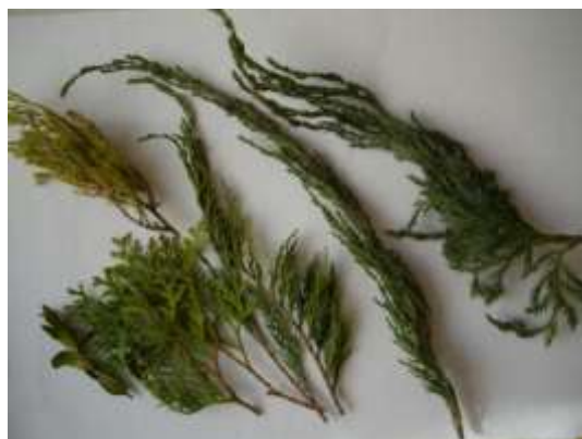
Гілочки хвойних рослин