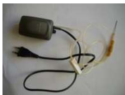
Компресор для акваріума допомагає видути вміст яйця